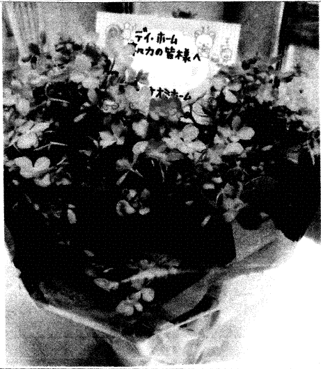
ありがとうございました。お返しはまた次回です。

まじりコーナーでは、エロや電車、キャラクターの地面にらくがきをし、遊びました。みんな絵が上手でした。宿泊行事中もみなさんご飯も良く食べ、よ