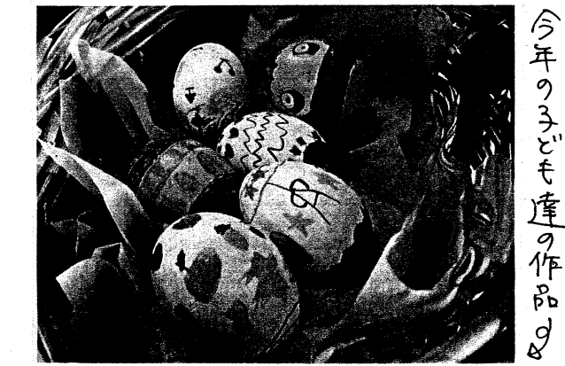
今年の子ども達の作品の